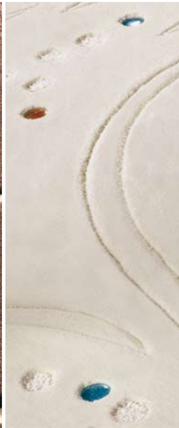
Handmade glass stones